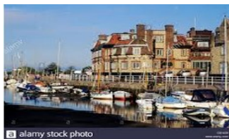
English coast village